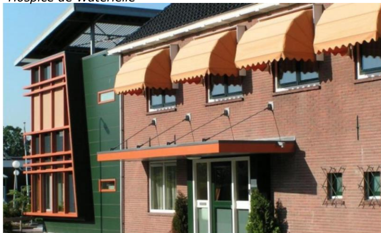
Hospice de Waterlelie

De Waterlelie Groene Kruisstraat 2a/b 3201 CA Spijkenisse T (0181) 698 889 E info@hospicedewaterlelie.nl www.hospicedewaterlelie.nl